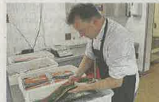
48 Stunden liegen die Fischhälften in der Beize.