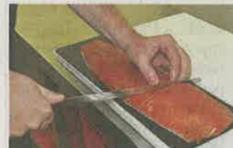
Die Filets werden in fingerdicke Tranchen geschnitten.

an der Großen Elbstraße unter Beweis. An der Hafenkante lernte er alles über Fische. „Und ich habe dort viele Kontakte geknüpft“, sagt er.